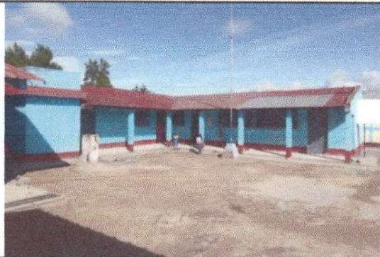
Foto 1: Sustitución de cubierta de lámina por lámina troquelada aluzinc calibre 26