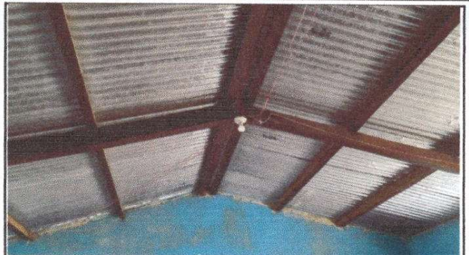
Foto 2: Estructura de techo, sustitución de soporte de madera por metal